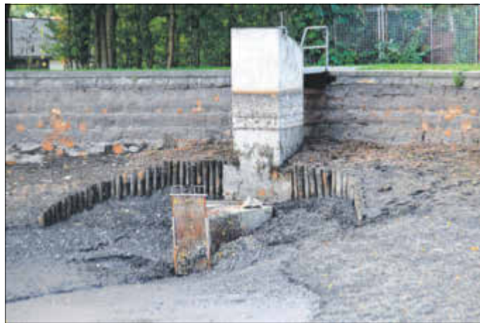
Der alte Teichmönch, der zur Regulierung des Wasserstandes dient, muss erneuert werden