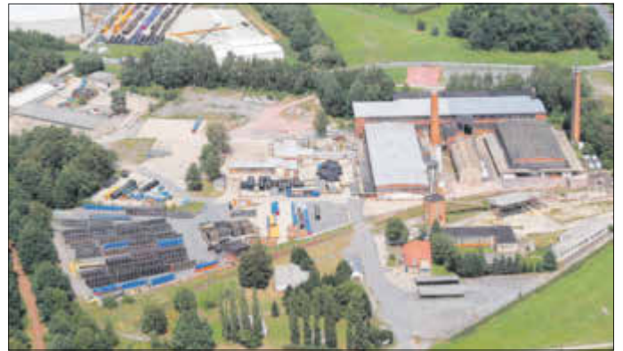
Blick auf das ehemalige Dachziegelwerk

Die Gemeinde Hohwald bemühte sich bereits lange um den Erwerb der Industriebrache „Dachziegelwerk Langburkersdorf“. Auch nach der Eingemeindung setzten sich diese Bemühungen fort. Am 9. Februar 2011 ergab sich dann kurzerhand die Möglichkeit, der Stadtrat wurde involviert und der Beschluss gefasst, das Areal zu erwerben. Mögliche Investoren konnten gefunden werden, um auch Fördermittel für den Abriss und die Revitalisierung zu akquirieren.