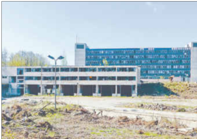
Ehemalige Industriebrache im Gebiet Kirschallee

Auch hier wurde im Rahmen der Förderung Gemeinschaftsaufgabe „Verbesserung der regionalen Wirtschaftsstruktur“ (GRW) ein entsprechender Antrag bei der Landesdirektion Sachsen zur Wiedernutzbarmachung dieses rund 14 Hektar großen Areals an der Kirschallee gestellt und bewilligt.