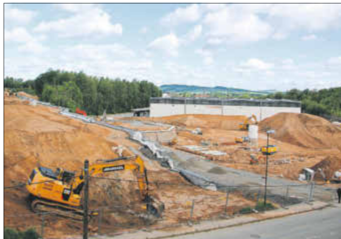
Großbaustelle Kirschallee im Juni 2017

Derzeit laufen die Vorbereitungen zum Verkauf einer weiteren Fläche an einen Investor. Die Erschließungsstraßen sind übergeben und das gesamte Areal soll bis Ende dieses Jahres fertiggestellt sein. Dann ist die größte Investition der zurückliegenden zehn Jahre getätigt.