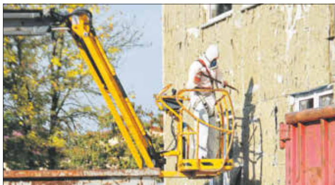
Abtragen der Fassade, des Putzes und des Dämmmaterials, bis nur noch das Stahlgerüst steht

tät von 194 Plätzen. Im neuen Kindergarten auf der Heinrich-Heine-Straße 5 beträgt diese insgesamt 120 Plätze, davon 36 für Krippen- und 84 für Kindergartenkinder. Im Zuge des Umzugs vom Alt- in den Neubau wurde vereinbart, die über die neue Kapazität hinausgehenden Kindergartenplätze für bereits aufgenommene bzw. zur Aufnahme zugesagte Kindergartenkinder auslaufend im Altbau zur Verfügung zu stellen. Daher erfolgte bis zum Ende des Schuljahres 2015/2016, also bis zum Sommer 2016, die Weiterbetreuung der Kindergartenkinder im Altbau des Pfiffikus. Seit September 2016 steht das Gebäude leer und wurde für den Rückbau vorbereitet.