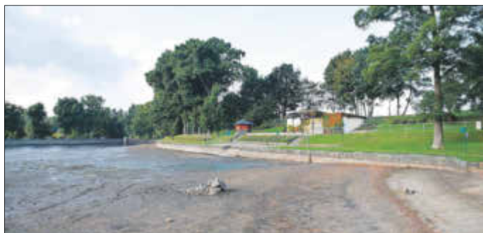
Der abgelassene Freibadesee am 22. September 2017, Foto: W. Thalheim

tober 2017. Die Lieferung des Betonfertigteils für den Teichmönch erfolgt Ende Oktober. Damit kann das Bauvorhaben Mitte November 2017 abgeschlossen und das Wasser im Freibadesee vor dem Winter wieder eingestaut werden.