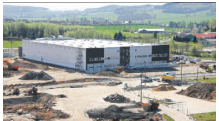
Im April 2012 war das Areal des ehemaligen Dachziegelwerkes eine Großbaustelle, neben dem Abriss des alten Werkes, der Revitalisierung und dem Bau von Straßen entstand die neue Produktionsstätte

Die bereits im IGP ansässige Firma Gerodur MPM Kunststoffverarbeitung GmbH & Co. KG erwarb eine Fläche von rund 5 Hektar, um für eine Erweiterung gewappnet zu sein. Der Zweckverband Abfallwirtschaft Oberes Elbtal (ZAOE) verlegte seinen Standort des Wertstoffhofes Neustadt ebenfalls in dieses Gebiet. Derzeit befindet sich die Erweiterung von Gerodur in der Umsetzung, für das Unternehmen Veritas und den ZAOE ist diese ebenso in Vorbereitung. Neben der Erschließung der Gewerbeflächen erfolgte parallel der Ausbau der Infrastruktur im Straßen- und Radwegenetz und der notwendigen Parkflächen, wie auch die umfangreiche Begrünung des Areals.