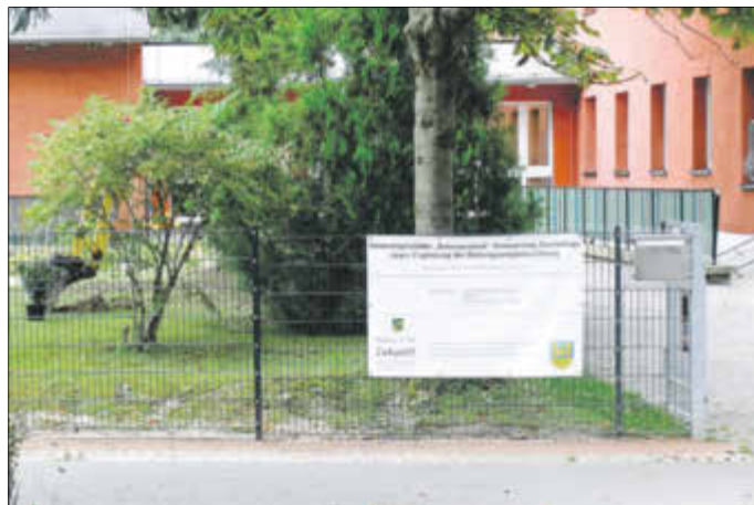
Ein Teil der neuen Zaunanlage im Eingangsbereich der Kindertagesstätte

durch Pflanzungen und Sichtschutzmaßnahmen ergänzt. Das durch die Ballfanganlage neu entstandene, kleine Fußballfeld weihten die Kinder und Erzieherinnen der Kindertagesstätte mit einem kleinen Festprogramm am 19. September 2017 zünftig ein. In einem zweiten Bauabschnitt, der noch in Planung ist, wird die Sicherheitsbeleuchtung erweitert.